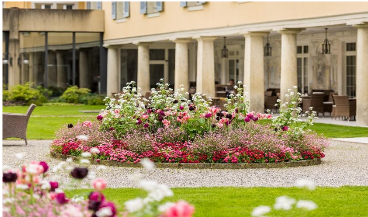
Kolonnade im Kurhotel Im Park