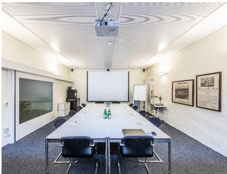
Seminarraum Samuel Jenner I